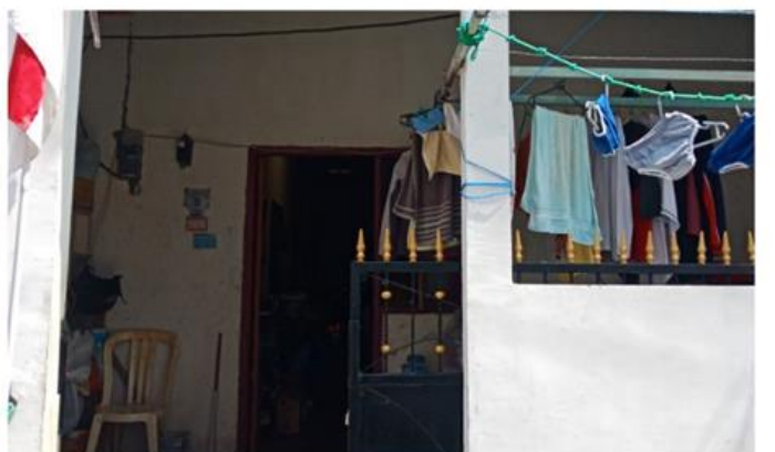
Jl. Balongsari Blok 2A No. 9