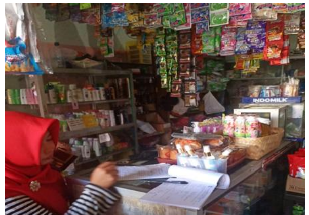
Toko Surya Jl. Mulyorejo Selatan Baru No 7