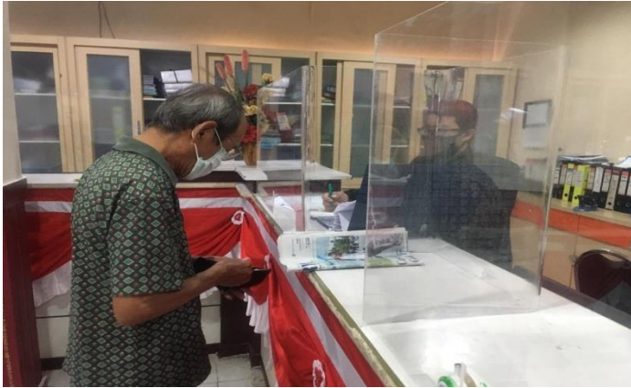
Pelayanan Loker Pengambilan