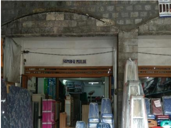
CV Sumber Mulia Jl. Putro Agung Kulon No. 3a-3b