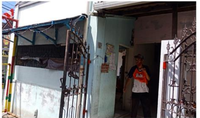
Jl. Balongsari Blok 2B No. 10