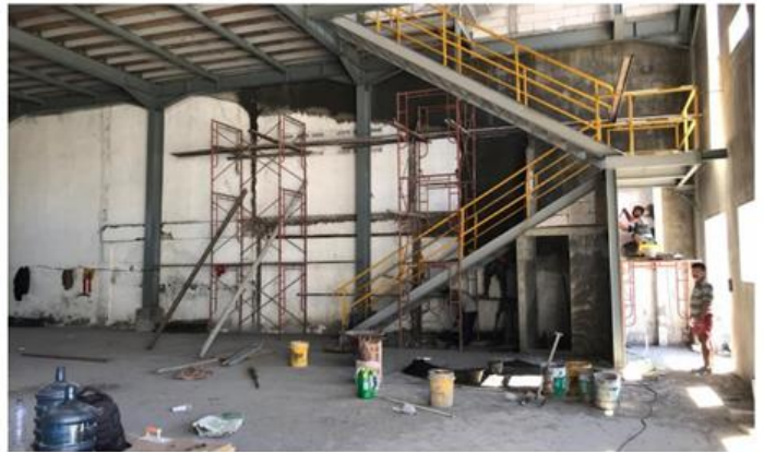
PT PRO BAJA INDONESIA Jl. Raya Romokalisari No. 43