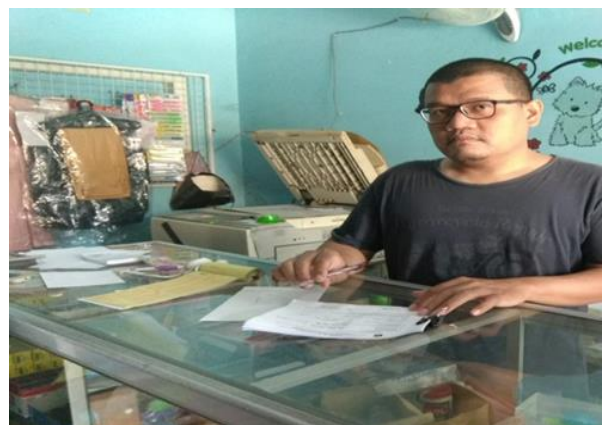
CV Sido Mulyo Jl. Rangkah V No. 26