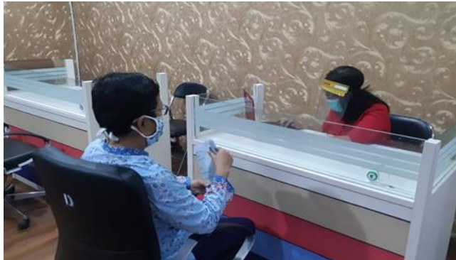
Karya Sindo Jaya