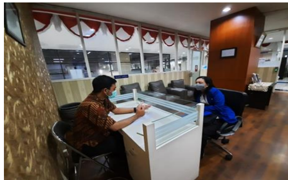
PT Wangta Agung

Jumlah Perusahaan yang Diberikan Asistensi Sebanyak 3 Perusahaan