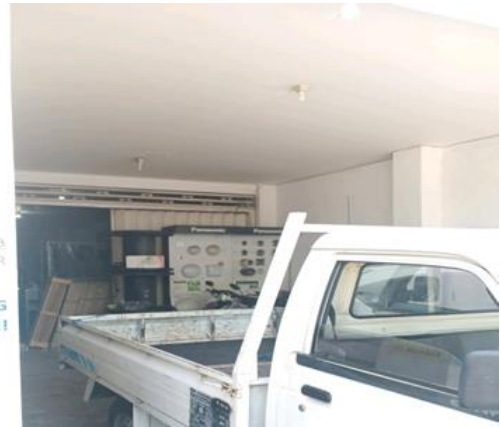
CV Pilar Abadi Nusantara Jl. Dr. Ir.H.Soekarno No. 22 A