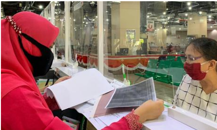
Pelayanan Loker Customer Services