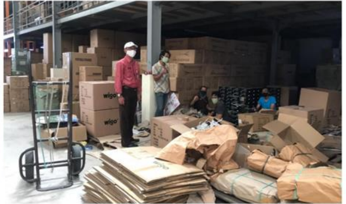
PT BUMI CENTRAL HARAPAN Jl. Tanjungsari No. 16