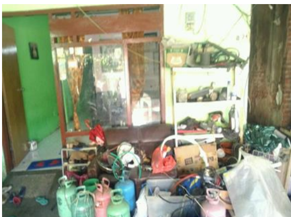
CV Miyanda Cool Jl. Petemon Sidomulyo 2 No. 24