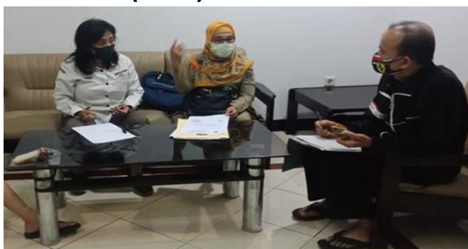
PO Ramayana Jl. Dinoyo No. 82