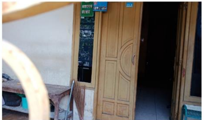
Jl. Balongsari Blok 2A No. 4