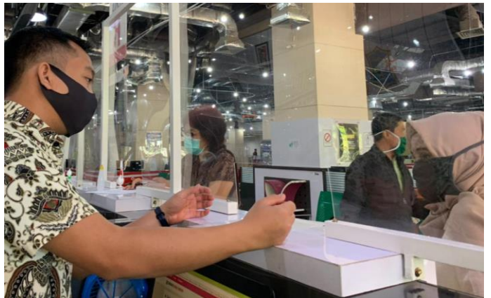
Pelayanan Loker Mandiri

Jumlah Permohonan Perizinan Yang Masuk Sebanyak 137 Berkas