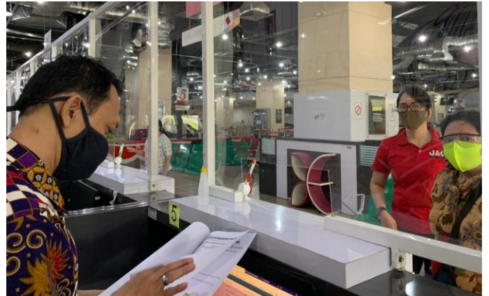
Pelayanan Loker Pengambilan