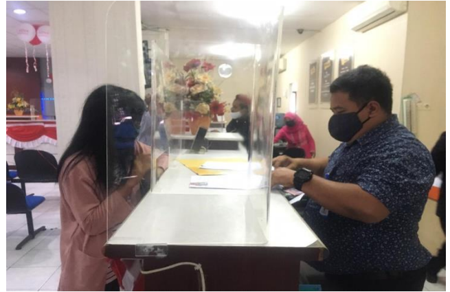
Pelayanan Konsultasi Dinas Kesehatan