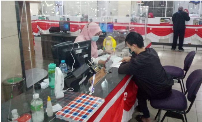
Pelayanan Loker Informasi