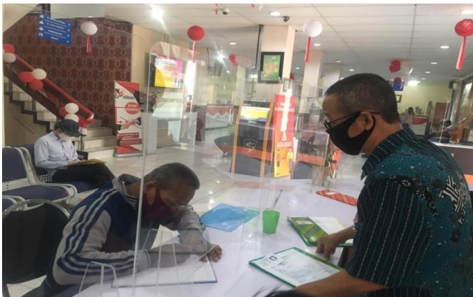
Pelayanan Loker Pencabutan Berkas