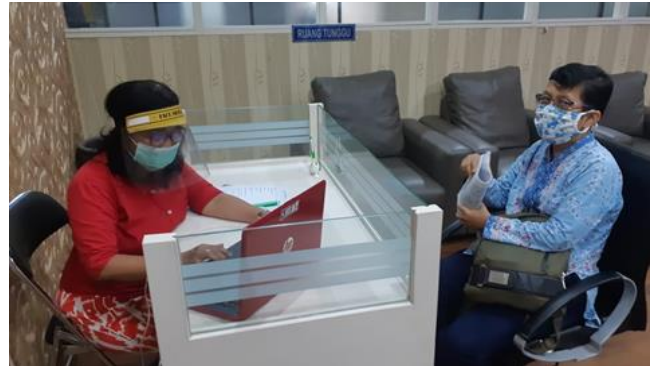
PT Kartika Jaya Makmur