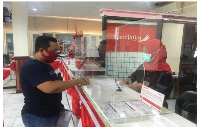
Pelayanan Loker Bank Jatim

Jumlah Permohonan Perizinan Yang Masuk Sebanyak 68 Berkas