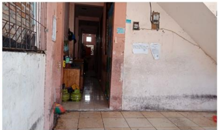
Jl. Balongsari Blok 2C No. 20