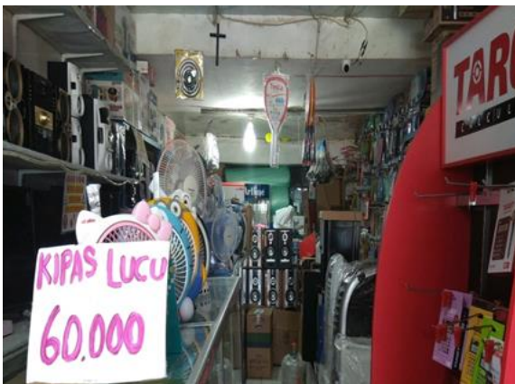
UD. Sami Jaya Jl. Pacar Keling 27