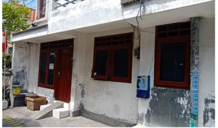
Jl. Balongsari Blok 2B No. 1